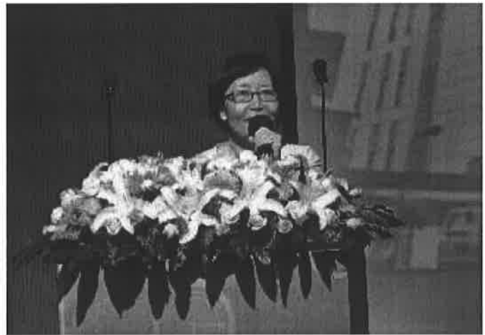
2010年7月8日舉辦銀行業放款及應收款減損評估適用第34號公報第3次修正案說明會