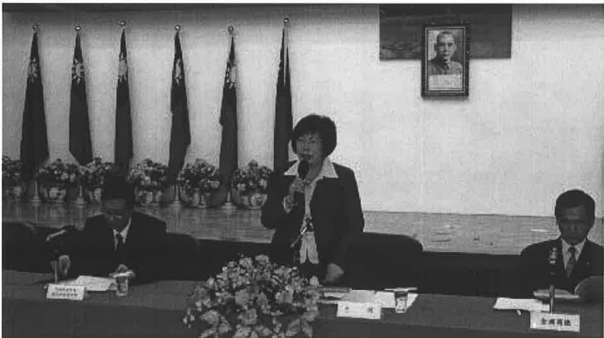
2010年9月15日舉行第10屆第1次會員代表大會