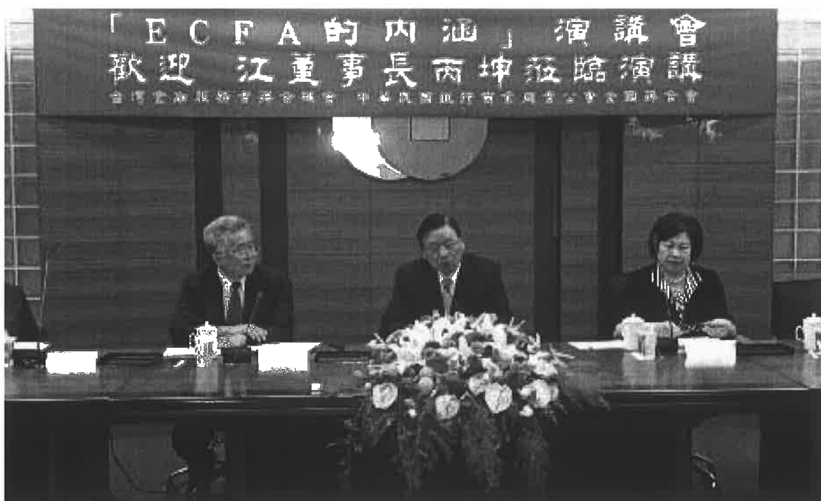
2010年8月24日舉辦ECFA的內涵演講會